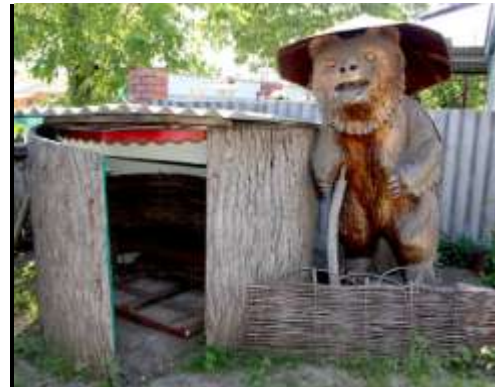
Экспонаты дома-музея Дончакова.

Самая известная работа мастера, «Голова богатыря» из поэмы «Руслан и Людмила» была вырезана примерно в 1983-84 годах. Стоит на углу улиц Красной и Октябрьской напротив СберБанка.