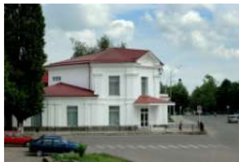
а ныне ЗАГС