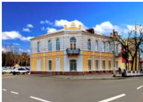
Здание милиции 2013год