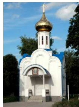
Часовня Пресвятой Троицы, угол ул.Ленина и Пролетарской