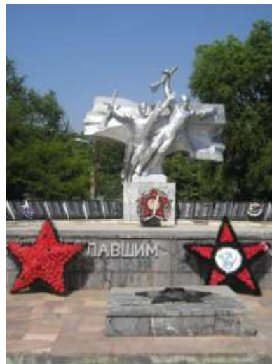
Воинский мемориал и Вечный огонь.