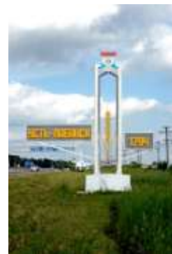
Въезд в город со стороны г.Краснодара

Большим достоянием и гордостью Усть-Лабинска являются его жители. Трудолюбивые, честные, искренние, всей душой болеющие за благополучие родной земли!