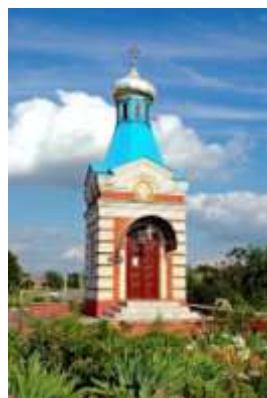
часовня на въезде в город