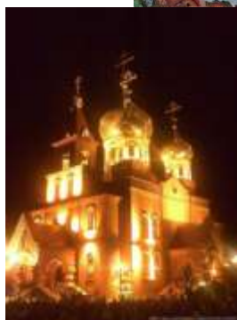
Поклонный крест в городском парке.