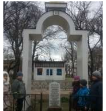
Поклонный крест в горпарке

Проехав по маршруту и услышав мой рассказ, ребята остались довольны. Моя одноклассница Настя Кривенчук обучается в музыкальной школе, но впервые узнала об истории этого здания. Мы с ребятами с удовольствием постояли под аркой педколледжа, рассмотрели знаменитое крыльцо краеведческого музея. Впечатлил нас своим величием Храм Преподобного Сергия Радонежского, печально было около мемориала и памятников погибшим солдатам.