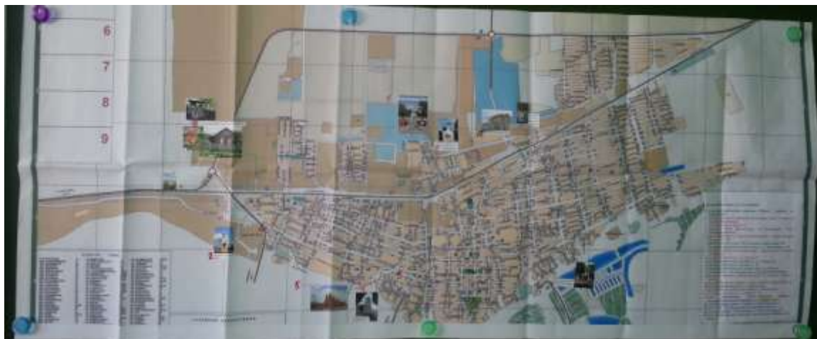
Карта города Усть-Лабинска с достопримечательными местами.

Знакомство с маршрутом достопримечательностей города учеников гимназии.