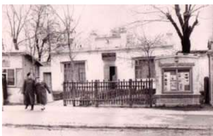
Чебуречная, а сейчас администрация района

11. Напротив сквера располагается здание администрации города и района.