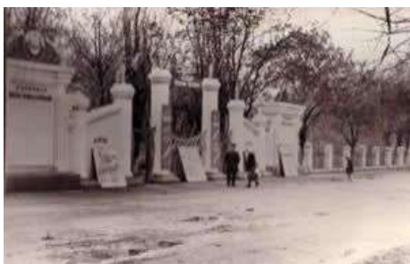
Вход в Горпарк 1960г.

7. Рядом с колледжем находится городской парк . Атракционы, качели, игровая площадка, кафе подарят хорошее настроение. На территории парка расположен небольшой зоопарк – станция юннатов. В нем живут разные животные и птицы, а также имеется аквариум с красивыми рыбками.