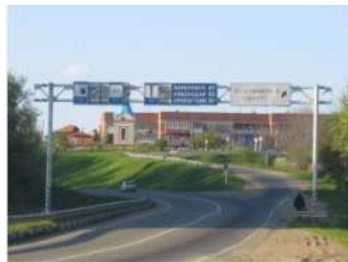
Въезд в город со стороны Адыгеи

2. Главной исторической достопримечательностью многие считают частично сохранившейся до наших дней Александровской крепости XVIII века. Здесь можно увидеть деревянный частокол, пушечные платформы с макетами пушек, а также можете подняться на смотровую площадку, с которой открывается прелестный вид на живописную южную природу.