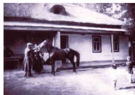
Отбор лошадей для службы

В 1793году Для строительства крепости был приглашен из Оренбурга главный инженер генерал Фере. Он несколько перестроил суворовскую крепость,